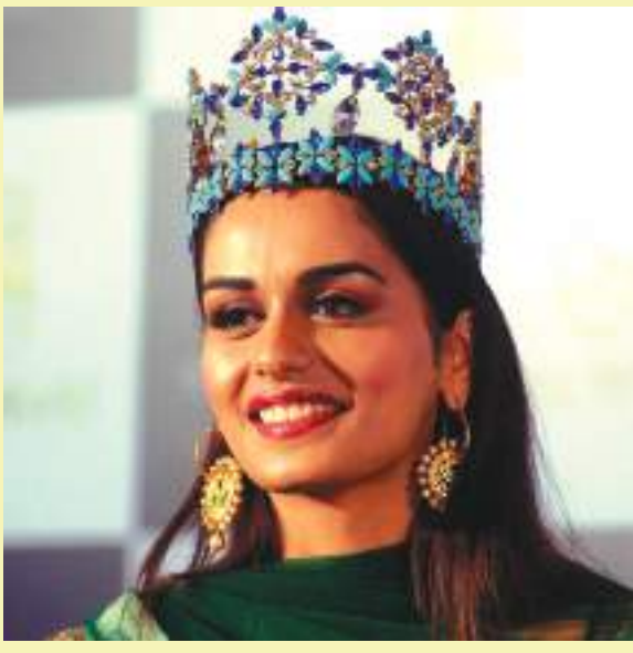
as Miss World in 2017 was born? Haryana