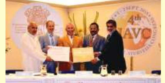
EMBASSY OF INDIA