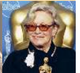
ഫ്രാൻസെസ് മക്ഡോർമാൻസ്, ക്ലേയ് ഷാവോ ആന്റണി ഹോപ്കിൻസ് ആൻ റോത്