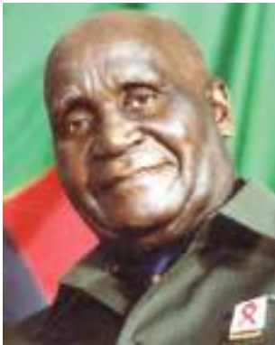
ഡോ. കെന്നത്ത് കൗണ്ട

ഡോ. ജൂലിയസ് നെയ്റേ (1922-99) 1961ൽ പ്രിമിയറും 1962ൽ രാജ്യം സ്വാതന്ത്രം റിപ്പബ്ലിക് ആയപ്പോൾ പ്രഥമ പ്രസിഡണ്ടും ആയി. മുൻ സയർ എന്നറിയപ്പെട്ടിരുന്ന ആഫ്രിക്കൻ രാഷ്ട്രമായ കോംഗോയുടെ സ്വാതന്ത്ര്യസമരം നയിച്ചയാളാണ് പാട്രിസ് ലുമുംബ (1925-61). രാജ്യത്തിന്റെ പ്രഥമ പ്രധാനമന്ത്രിയായ (1960-61) ഇദ്ദേഹം മുപ്പത്തിയാറാം വയസ്സിൽ വധിക്കപ്പെട്ടു. ഉത്തര റൊഡേഷ്യ അഥവാ സാംബിയയുടെ മോചകനാണ് (1964) 'ആഫ്രിക്കൻ ഗാന്ധി' എന്നറിയപ്പെടുന്ന ഡോ. കെന്നത്ത് കൗണ്ട. സ്വാതന്ത്ര സാംബിയയുടെ പ്രഥമ പ്രസിഡണ്ടും അദ്ദേഹമായിരുന്നു. പോർച്ചുഗൽ മോചിപ്പിക്കാൻ അന്വേഷിച്ച അന്റോണിയോ ആഗസ്റ്റിണോ നീതോ (1922-79) സ്വാതന്ത്രാനന്തരം രാജ്യത്തിന്റെ ആദ്യപ്രസിഡണ്ടുമായി. സൈപ്രസിനെ വിദേശഭരണത്തിൽനിന്നു മോചിപ്പിച്ച പുരോഹിതനാണ് ആർച്ച് ബിഷപ്പ് മക്കാരിയോസ് (1913-77).